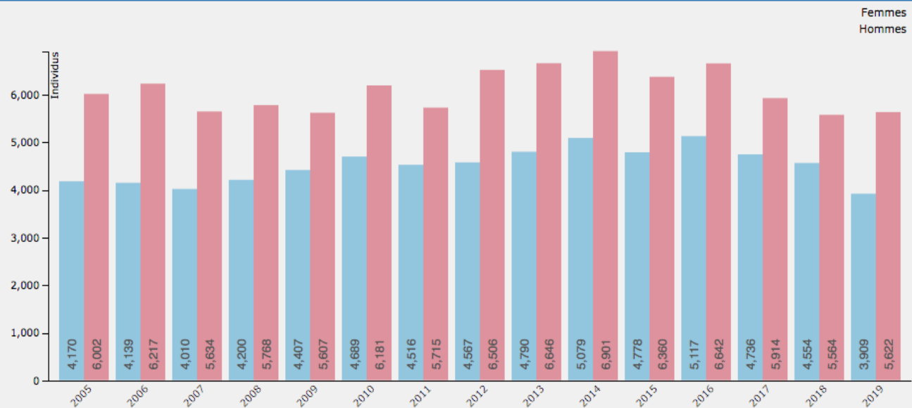
ÉVOLUTION DES LICENCIÉS *