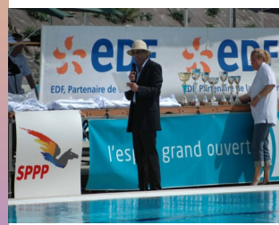
Le soleil au rendez vous de l'organisation du tournoi des 4 nations à LAVAL.