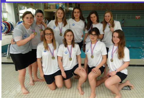
Les filles se bronzent à LONGWY!