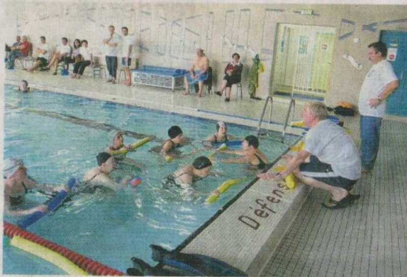
Les explications des éducateurs.

Ils font des longueurs de bassin, avec leurs mouvements et leur rythme, sous la conduite d'un animateur qui observe et donne ses conseils. Samedi après-midi, le bassin nautique de la piscine Valley, à Amboise, n'était pas le lieu d'un entraînement sportif mais l'endroit où la santé passe par la natation. La piscine accueillait, en effet,