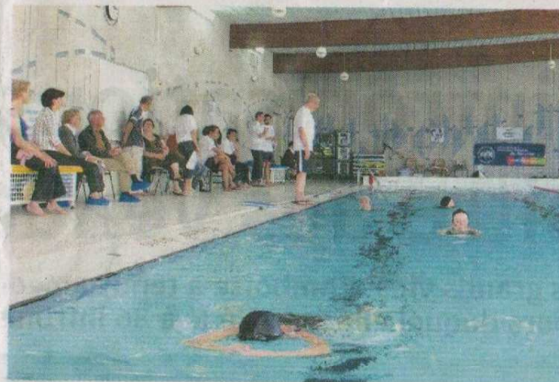
Des exercices dans le bassin.

la première journée régionale « Nagez Forme Santé » organisée par la Fédération française de natation avec l'aide du club amboisien. Cet après-midi placé sous le signe de la santé a débuté par des démonstrations dans l'eau de cette activité qui s'adresse aussi bien aux personnes ayant eu des problèmes de santé plus ou moins importants (mal de